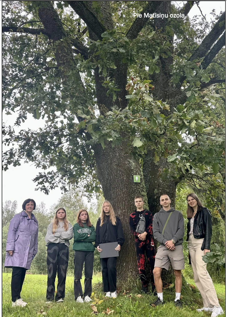
Pie Matīsiņu ozola