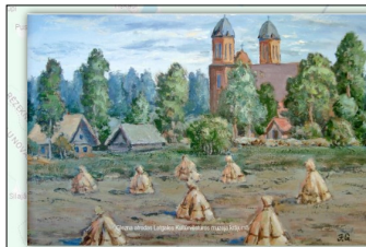
RĒZEKNES NOVADS Prezmas baznīca