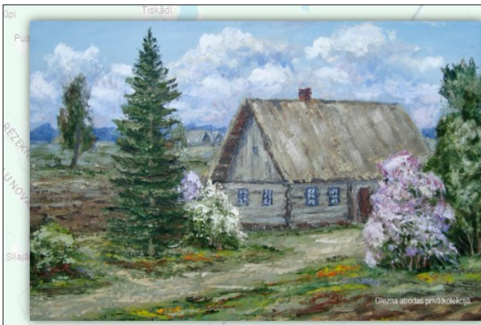
RĒZEKNES NOVADS Tēva mājas Kovaļovkā