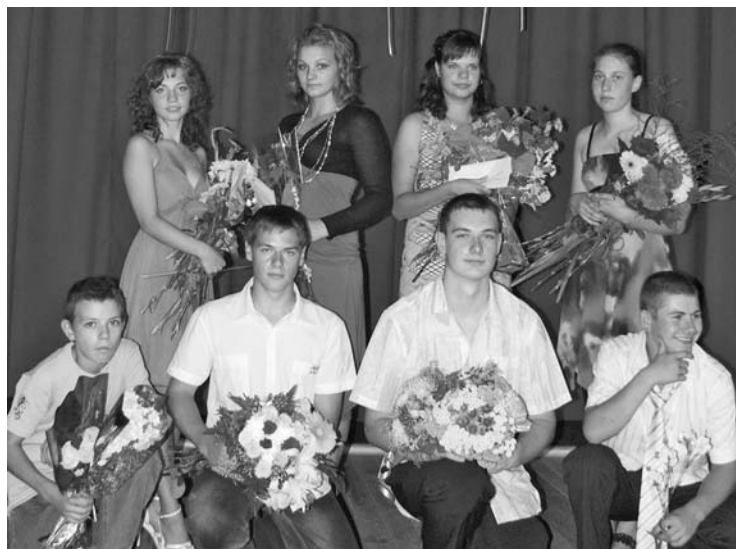
16. augustā Silmalas KN notika Pilngadības svētki.

Vakaru vadīja teātra studijas «Joriks» aktieris. Skatot mūzikai, zālē ienāca svinību vaininiekus – tik jauni un skaisti. Tiesa, tikai astoņi cilvēki, puse no pilngadniekiem, kurus godināja šajā pasākumā. Apsveicami, ka jaunieši tomēr atrada laiku, lai atnāktu uz svētkiem, kas tika orga-