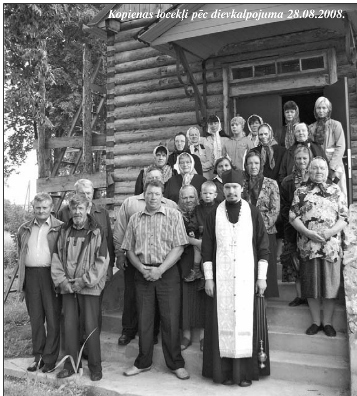
Kopienas locekļi pēc dievkalpojuma 28.08.2008.

Šogad Tiskādu Sv. Trīsvienības pareizticīgo dievnamam izpildās 130 gadi kopš kopienas nodibināšanas un dievnama uzcelšanas tālajā 1878. gadā.