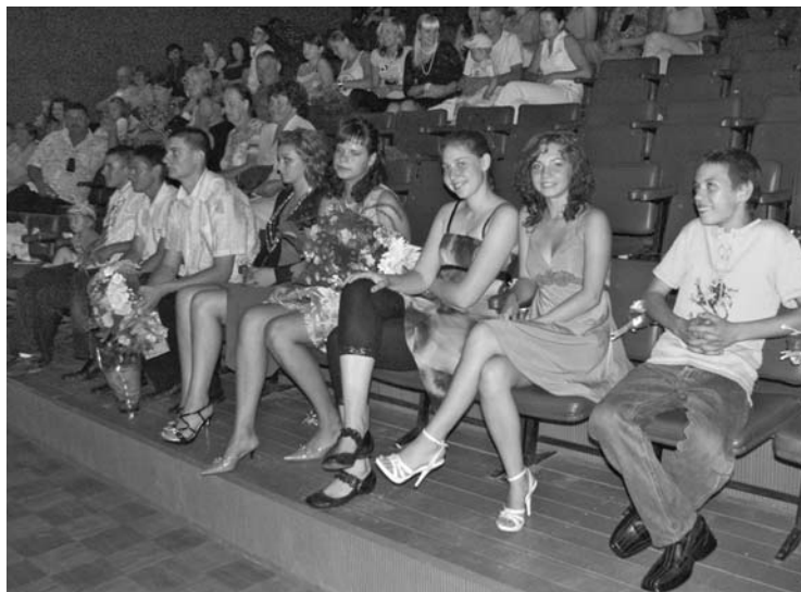
16 августа в Силмалском ДК прошел праздник совершеннолетия.

Вечер проводил артист театра-студии «ЙОРИК». Под звуки музыки в зал вошли виновники торжества – такие молодые, красивые, нарядные. Их было 8 - это лишь половина из тех, которых собирались чествовать на этом мероприятии. Молодцы ребята, которые все-таки нашли время, чтобы прид-