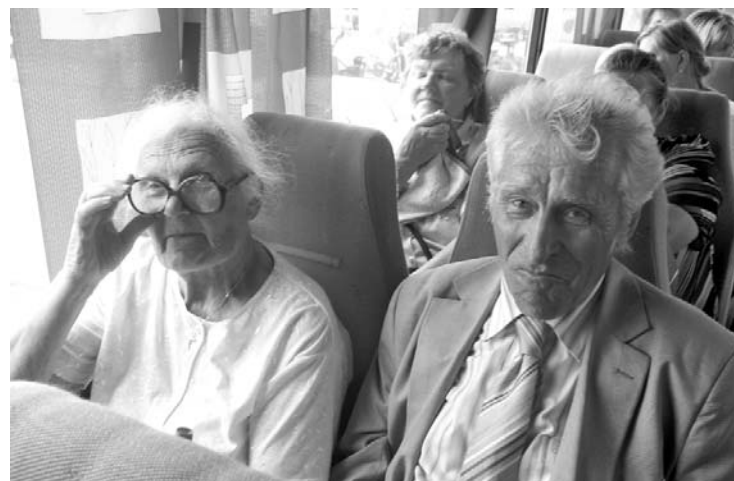
Наша поездка на праздник в Аглону началась 15 августа в 6.30 утра. Это было теплое, спокойное, солнцем освещенное начало дня. Явились почти все из тридцативосьми желающих ехать в Аглону.

По дороге к этому святому месту мы пели духовные песни на латгальском языке – это было, своего рода, вступлением к нашим молитвам, обращенным празднику вознесения пресвятой Богородицы на небеса.